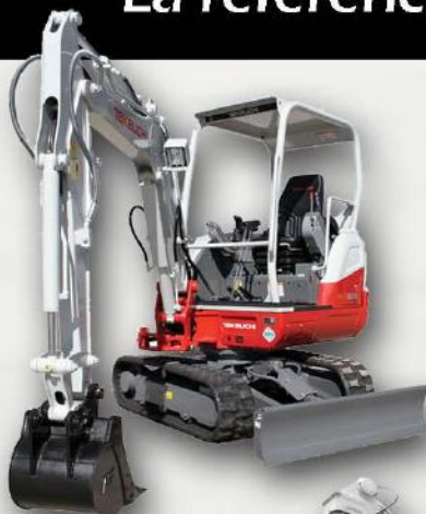
MINI ET MIDI-PELLES 1T à 9T