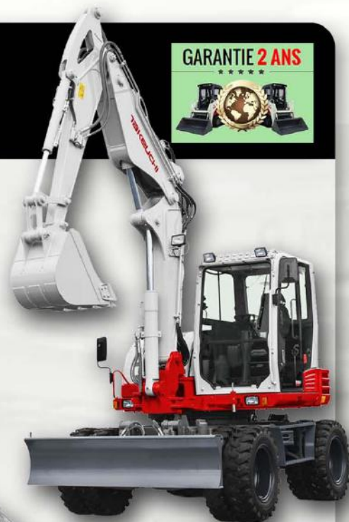
PELLE SUR PNEUS 11T