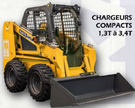
CHARGEURS COMPACTS 1,3T à 3,4T