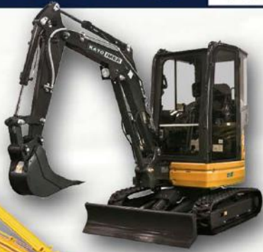
MINI-PELLES URBAINES 0,9T à 8T